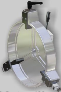
Shaft Centerer 400

Der Shaft Centerer ist ein mobiles Gerät zum Zentrieren von Wellen. Die Einstellung des Durchmessers erfolgt über ein Handrad und kann an der Skala abgelesen werden. Der Durchmesser kann genau eingestellt werden. Der Einstellbereich beträgt 60 mm. Über Spannbackenverlängerungen kann der gesamte Bereich abgedeckt werden.