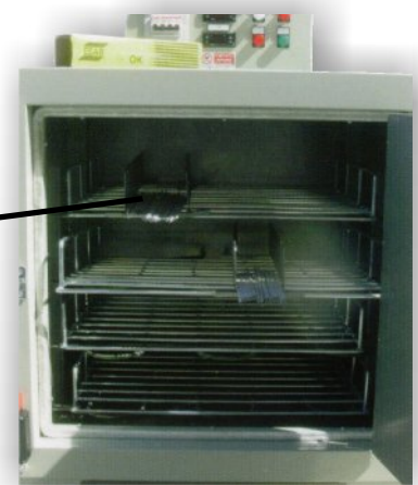
4 Ebenen mit Trennelementen für ca. 6000 Elektroden 4 shelves complete with seperators