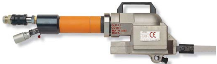
Rohrsäge mit Pneumatiktrieb Artikel-Nr.: 02700/05

Führungsband von 4" - 12" Pipe locking device for 4" - 12"