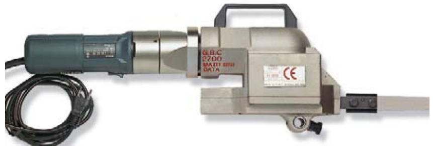
Rohrsäge mit Elektroantrieb Artikel-Nr.: 02700/05E

Saw with pneumatic drive article-no.: 02700/05