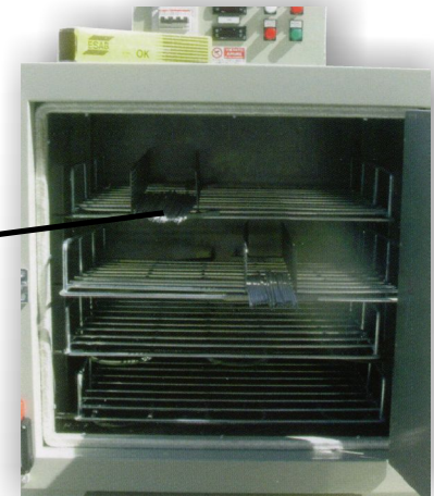
4 Ebenen mit Trennelementen für ca. 6000 Elektroden 4 shelves complete with seperators for ca. 6000 electrodes