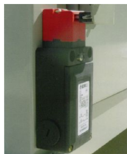
elektrische Sicherheitsverriegelung automatic safety door latch